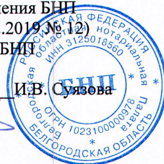
График приема граждан нотариусами Старооскольского нотариального округа Белгородской области в Роговатовской и Шаталовской сельских территориях Старооскольского городского округа Белгородской области на 1-е полугодие 2020 года Место приема: административные здания сельских территорий