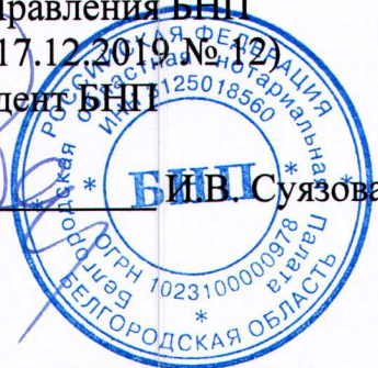
График приема граждан нотариусами Шебекинского нотариального округа Белгородской области в Беянской, Белоколодезянской, Купинской, Первоцепляевской территориальных администрациях Шебекинского городского округа Белгородской области на 1-е полугодие 2020 года Место приема: административные здания территориальных административных учреждений